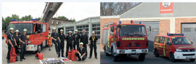
Die Kameraden während einer Weiterbildungsmaßnahme.

Über ihre Aktivitäten, die Mannschaft und alle Neuigkeiten rund um die Löschgruppe Hilfarth informieren wir laufend und aktuell auf unserer Internet-Seite www.feuerwehr-hilfarth.de . Außerdem finden Sie hier Tipps und Hinweise für den alltäglichen Gebrauch in der Rubrik „Service“.