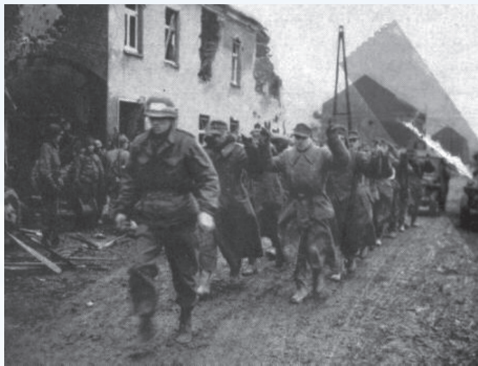
Amerikaner führen die deutschen Kriegsgefangenen auf der Kaphofstraße (links Hilfarther Korbhaus Fell) Richtung Himmerich.

Behinderten der nasse Winter 1944/45 und die gleichzeitige deutsche Ardennenoffensive den Vormarsch der Alliierten, erzielte die deutsche Kriegsführung eine weitere Verzögerung um etwa zwei Wochen durch die Sprengung der Grundablassrohre des Rurtalsperrenverbunds am 10./11. Februar mit der Folge, dass der Fluss sich bis zu 300 Metern Breite ausdehnte. Den Großangriff zum Rurübergang mit der „Operation Granade“ (Granate) begannen die Amerikaner am 23. Februar auf dem Abschnitt Düren – Körrenzig mit gut vorbereiteten Aktionen einschließlich mobiler Brückenbauten. Der Befehl zur Einnahme Hilfarths und zur Schaffung des Rurübergangs durch „Granade“ erging am Abend des 25. Februars, die Amerikaner trafen auf den Minengürtel, der sofort eine Reihe