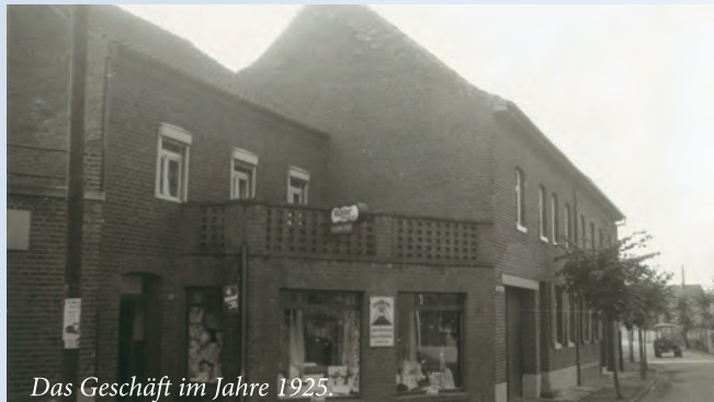
Das Geschäft im Jahre 1925.

Das Traditionshaus Esser an der Breite Straße 29 in Hilfarth feiert Geburtstag.