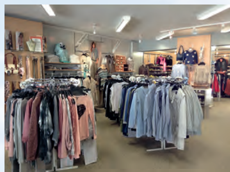
Eine gut sortierte Auswahl an modischer Kleidung trifft wohl jeden Geschmack.

Individuelle Beratung wurde bei uns immer groß geschrieben, so soll es auch in Zukunft sein. Testen