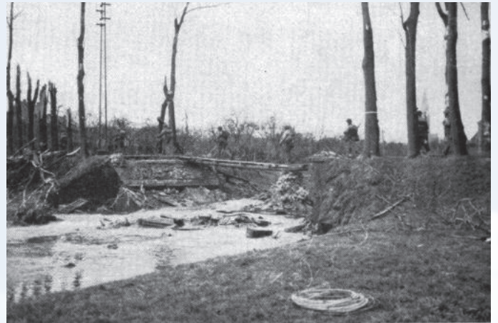
Amerikanische Soldaten auf einer Behelfsbrücke über den Flutgraben auf der Kaphofstraße. Die im Volksmund „steenerne Bröck“ genannte (steinerne) Brücke war von den Deutschen gesprengt worden. Im Vordergrund liegt noch eine Rolle Sprengkabel.

Am 26. Januar 1945, einem Freitag, kam auch für Hilfarth die Befreiung vom Herrschaftsregime des Nationalsozialismus' in Sichtweite: Eine Patrouille der 9. US-Armee erreichte am Nachmittag den Südrand des Rur-Orts, nachdem sie am Morgen Brachelen nach langen Stellungskämpfen hatte einnehmen können. (Z. B. Buch Hans Kramp: Rurfront 1944/45) Unter anderem die deutsche Ardennenoffensive im Dezember 1944 hatte den Abzug amerikanischer Truppen aus dem Raum Geilenkirchen notwendig gemacht.