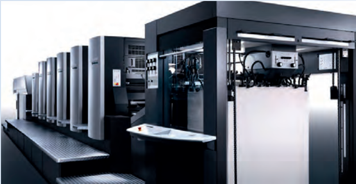
Am Standort in Düsseldorf wird mit Heidelberger Druckmaschinen produziert.

Die Medienpartner Mäurer GmbH wurde vor 34 Jahren (1981) unter dem Firmennamen Baumann & Mäurer in Düsseldorf als reiner Fotosatzbetrieb gegründet. Seitdem vertrauen unsere Kunden, zu denen Verlagshäuser und Vereine sowie Institutio-