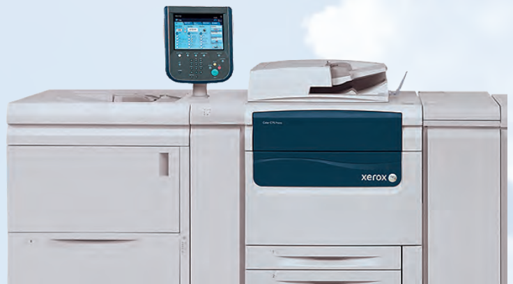
In Hilfarth werden die Kleinauflagen auf einer Xerox-Digitaldruckmaschine gedruckt.

Nach der Umfirmierung in Medienpartner Mäurer GmbH und dem Umzug nach Hilfarth im Jahr 2009, bietet unser Unternehmen neben dem Digitaldruck für Broschüren und Familiendruck-sachen auch Poster, Plakate, Fahnen, Schaufensterbeschriftung, Banner und T-Shirt-Druck an.