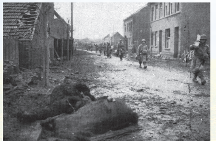
Amerikanische Soldaten auf der Breitestraße in Hilfarth auf dem Weg zur Rurbrücke. Links liegen zwei tote Pferde.

Vor allem die 9. US-Armee rückte von Süden her vor, um im Rahmen der Großoperation „Queen“ der Alliierten ins „Herz Deutschlands“, dem Ruhrgebiet, vorzudringen und dem Nazi-