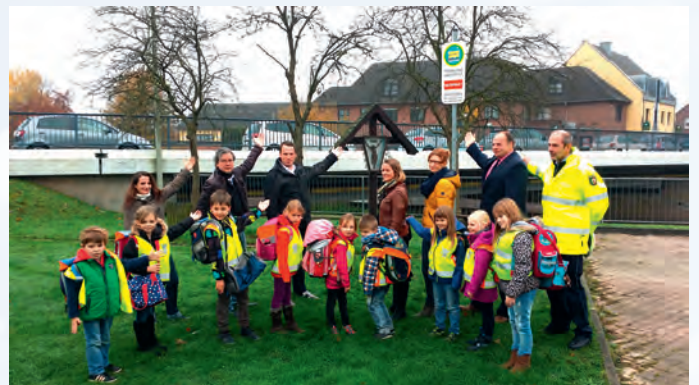
Eröffnung Walking Bus mit dem Bürgermeister

Grundschulkinder sollten den Schulweg – wo immer möglich – nicht im elterlichen Auto, sondern zu Fuß zurücklegen. Die positiven Effekte des „Zu Fuß zur Schule Gehens“ sind nicht nur die Sicherheit auf dem Schulweg, sondern auch gesundheitliche Aspekte und die Reduzierung des Verkehrsaufkommens. Der Schulweg zu Fuß wird sicherer und macht mehr Spaß, wenn Kinder ihn gemeinsam zurücklegen. Aus diesem Grunde hat das Schulleitungsteam der GGS Hilfarth die Aktion „Walking Bus“ ins Leben gerufen. Der „Walking Bus“ fährt nicht auf vier Rädern, sondern es handelt sich um eine von einem oder mehreren Erwachsenen begleitete Schülergruppe, die wie ein Linienbus nach Fahrplan feste „Haltestellen“ anläuft, die vielen Hilfarthern sicherlich schon aufgefallen sind.